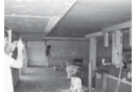
das Café nimmt Gestalt an