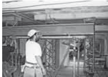
war das der Bäckerei-Laden der dreischiibe?